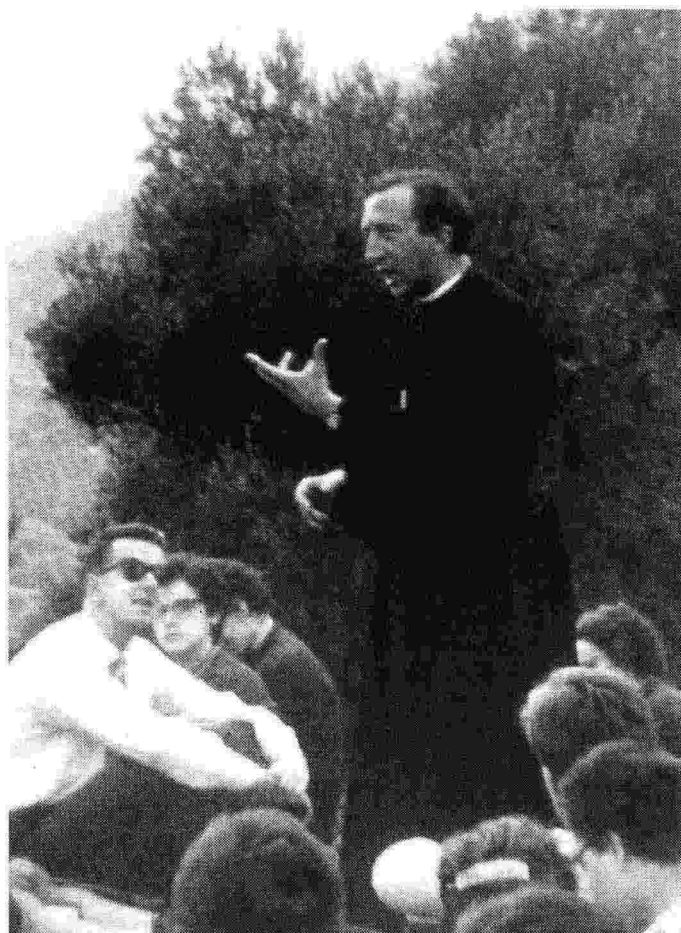
Luigi Giussani parla ai giovani nel luglio 1960

Solo un incontro può ridestare nei ragazzi le esigenze essenziali negate dal potere